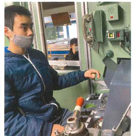
電車の運転をしました！