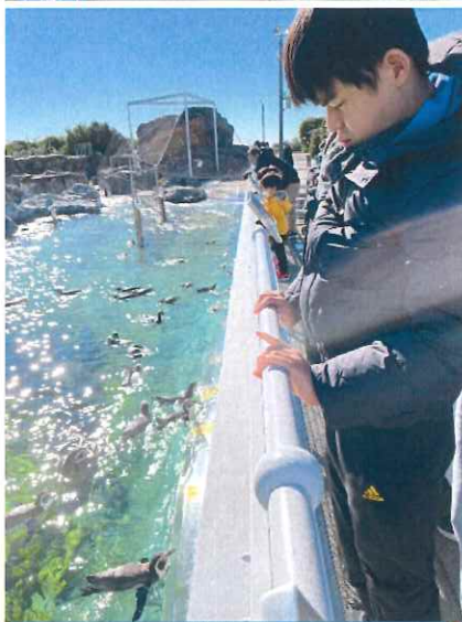
水族館にも行きました！