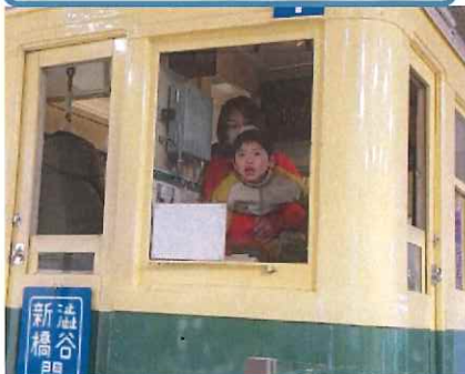
地下鉄博物館へ行ったよ☆